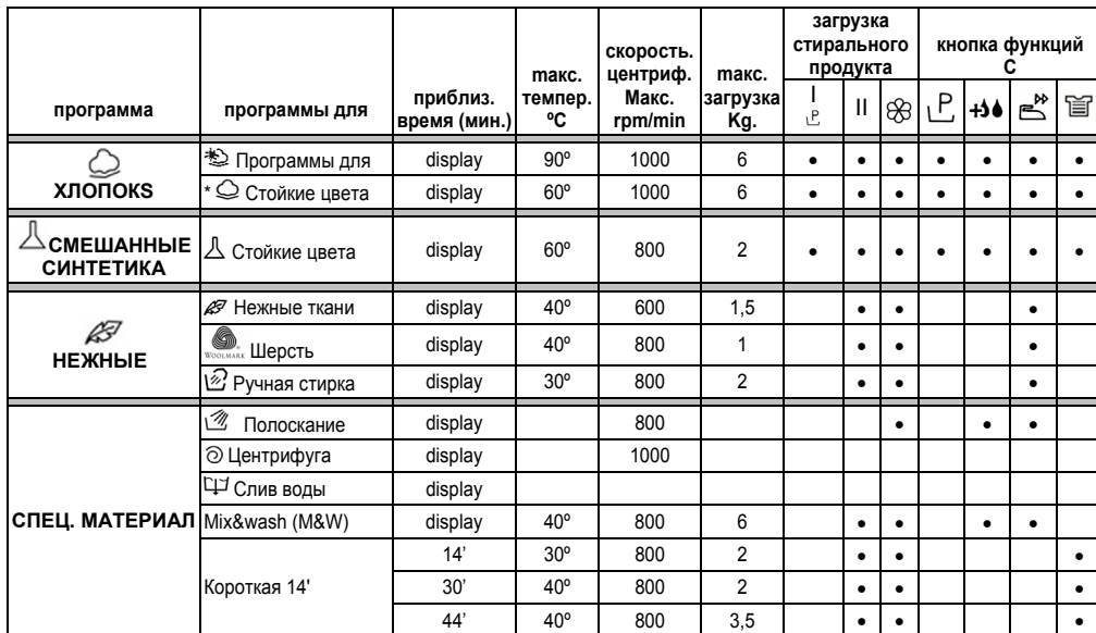
Таблица программ мод. CTD 10762

* Рекомендуемая программа для стирки теплой водой (температура ниже указанного максимума). Тестовая программа стирки на соответствие требованиям стандарта CENELEC EN 60456 с максимальной степенью загрязненности.